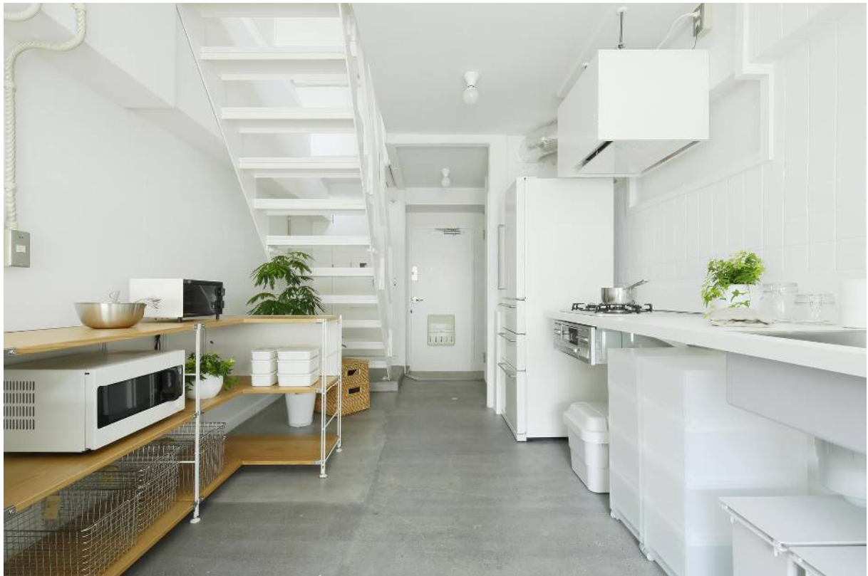
（名古屋市北区 水草団地 プラン Re+023）

（※）「MUJI × UR 団地リノベーションプロジェクトについては、別添をご覧ください。