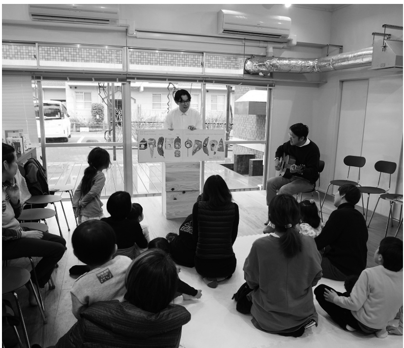
絵本をギターの演奏に合わせて歌い聞かせ。子どもたちも真剣な眼差し。

この団地の管理を所管している多摩エリア経営部との連携により開催された「TOUR（ツアー）」と名付けられたイベントでは、集会所内に暮らしなどにまつわる本を集めた本棚を設置。ギターの演奏とともに絵本を読み聞かせる「歌い聞かせ」では、音読に合わ