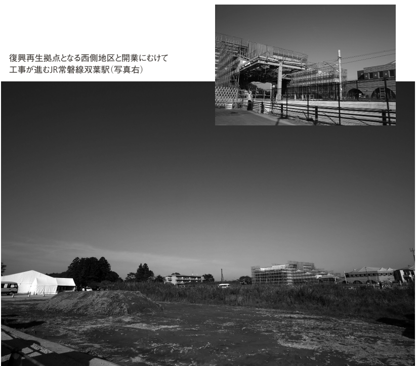
復興再生拠点となる西側地区と開業に向けて工事が進むJR常磐線双葉駅(写真右)

福島県原子力災害被災12市町村で、唯一全町避難が継続している双葉町。しかし、取材に訪れて驚