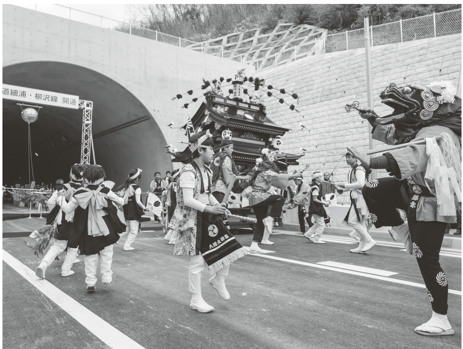
悲願のトンネル開通に喜ぶ山田町の人たち

の方々に深く感謝を申し上げたい」とあいさつ。子どもたちも交えた、地元伝統の八幡大神楽演舞がにぎにぎしく華を添えた。