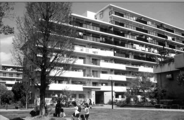
充実する高齢者支援施設の隣接で新しいライフスタイルが生まれる日吉の街

子どもたちや若い世代などの地域住民と、高齢者が共存するための場所。コンフォール南日吉は、そんな「地域の核」に発展する可能性を秘めている。