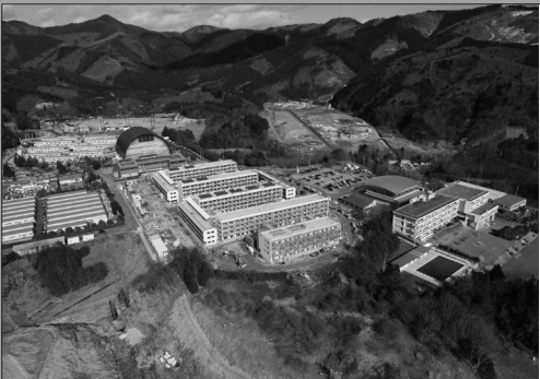
新しいまちづくりで生まれ変わる女川町、写真中央が災害公営住宅