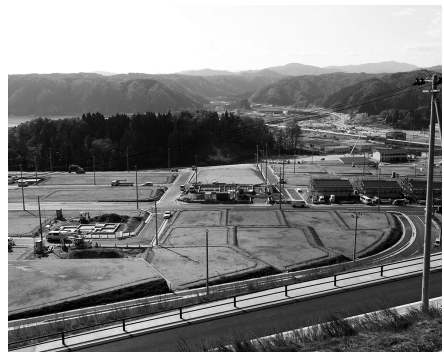
高台への移転で田老の防災はさらに強固に

今回造成された高台の土地は、昭和8年の昭和三陸大津波後の復興計画でも、移転の計画が持ち上がったことがあった。しかし、当時の土木技術では困難なことから見送りに。80年の時を経て、その