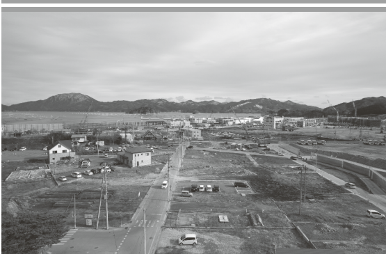
右側中程が盛土された駅前商店街予定地。その奥には災害公営住宅が建設中。

「URは震災直後から町と手を組んで復興まちづくり支援を続けてきました。私が赴任した24年度は住宅再建が最優先課題でした。しかし、なりわいの再生も含めた生活再建をしなければ復興とは言えません。そのためにソフト面からも支援する必要があります。25年度からは都市計画などの足元固めから補助金申請に係る協議・図書作成に至るまで、地元のみなさんご意見を聞きながら、