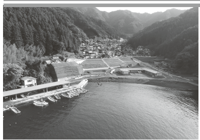
漁港 作業場、居住地と整備された花露辺のまち。

震災から5年がたったこの7月18日、「復興支援への感謝の夏祭」が盛大に開かれた。住む場所と生業。生きるためになくてはならない2つの復興を果たした花露辺のまちに、明るい笑顔とにぎわいがようやく戻ってきた。