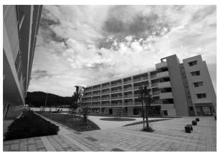
鹿折地区に完成した災害公営住宅は復興のシンボリックな存在

んは「買い物する場のない被災地で、いち早く出店して復興を支援したい、という思いで工事を急ぎました。エントリー制度は、トータルのまちづくりの一環として出店できることに加え、URさん間に立っていただくことで情報を共有しながら、地権者さんとの交渉も進めていくことが出来ました」と話す。