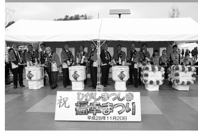
ひがしまつしま福幸まつり。鏡開きで新たな門出を祝う。

未曾有の大事業を遂行するため、東松島市がパートナーとして選んだのが、UR都市機構だ。阪神・淡路大震災、新潟中越沖地震などの復興事業の実績を見込まれ、2012年3月に東松島市とURは「復興事業推進」の協力協