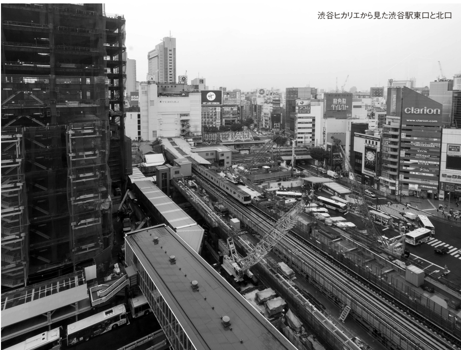
渋谷ヒカリエから見た渋谷駅東口と北口

こうした多岐にわたる複雑かつ重層的な事業を円滑に行うために大きな役割を果たしているのが、URだ。多摩や港北などのニュータウン開発から、大手町などの既成市街地の再開発など、まちづくりに関する膨大なノウハウの蓄積と、独立行政法人である公正・中立な立場を生かし、いままでもさまざまな都市再生事業を遂行してきた。渋谷駅街区では東急電鉄と