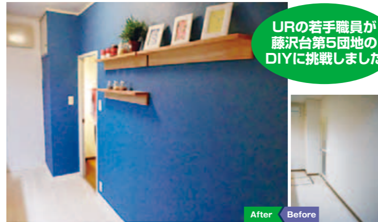
URの若手職員が藤沢台第5団地のDIYに挑戦しました

キッチン 材料費 4万円 無垢のフローリング材を床に使用し、壁はブルーに塗り替え。棚も設置し、かわいいキッチンに。