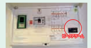
ピークアラーム機能付分電盤

ピークアラームは、電気の使い過ぎを音声メッセージでお知らせする装置で、これまでに約12万戸のUR賃貸住宅に設置しています。 今回モニター設置するものは、これまでのものと違い電力会社との契約電流より低い値で音声メッセージが出るよう設定します。これにより、使用量の目安をランプの色で表示する機能と合わせて、節電意識の向上が期待できます。 モニター設置(7月~8月)の対象は、東京電力管内のUR賃貸住宅にお住まいの100世帯。使用状況や改善案などをアンケート調査し、今後のピークアラーム普及の参考としていきます。