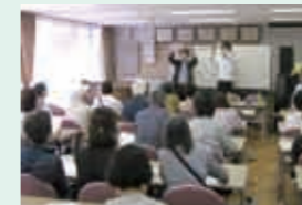
栽培講習会(H23.5.19 小平団地)