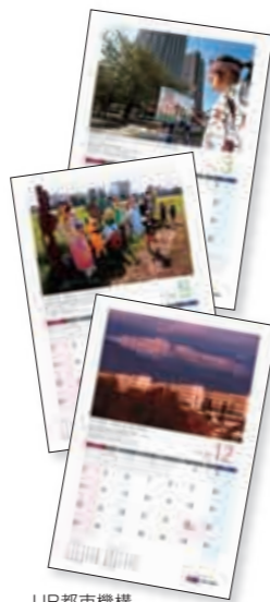
UR都市機構 2011年カレンダー

詳しくは、ホームページをご覧ください。 http://www.ur-net.go.jp/info/calendar/ ✉ メールでのお問合せ calendar@ur-net.go.jp