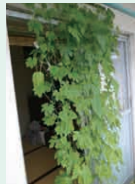
緑のカーテン実施例

「緑のカーテン」とは、ゴーヤなどのつる性植物を窓辺で栽培して窓を覆うもので、室内への暑い陽射しを和らげたり、葉っぱの間からすり抜けてくる涼しい風によりエアコン使用の低減効果が期待できます。 UR都市機構は、この緑のカーテンを、UR賃貸住宅にお住まいのお客様が団地のバルコニーで実施することを推進しており、平成23年度は、全国で約150団地、約6000戸に栽培キットを提供し、緑のカーテンを実施していきます。 また、開催希望があった団地では、職員が講師となり、栽培講習会も実施しました。