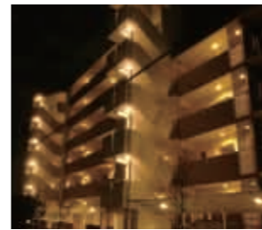
LED照明設置例 (金町第一団地/東京都葛飾区)

これに加えて、今回の取り組みにより、お住まいのお客様との連携を図って住宅内の節電を推進することで、家庭部門に掲げられた東京電力管内の節電目標15%の達成に貢献したいと考えています。