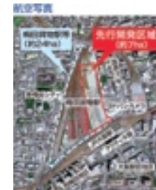
大阪駅北地区まちづくり基本計画(大阪市)土地利用ゾーニング