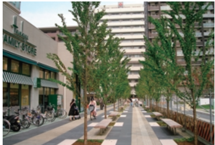
街のメインストリートは、病院の西口玄関まで続く

大阪市天王寺区の「桃坂コンフォガーデン」は、大阪赤十字病院の建替えにあわせ、民間事業者とUR都市機構の開発により誕生しました。隣接する大阪赤十字病院を最大限に生かし、医療を核とした新しいスタイルのまちづくりの成功例です。大阪赤十字病院の目前に広がる約1・7haの敷地は、クリニックモジュールに有料老人ホームや保育所を併設した「街区、賃貸住宅の」街区、分譲タワーマンションの「街区」の4