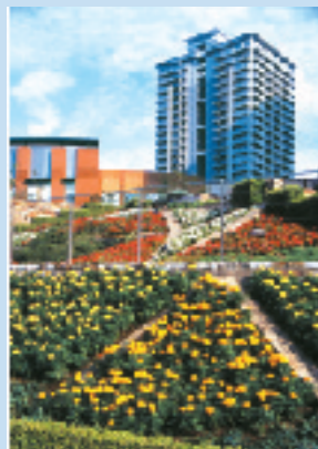
《表紙の風景》 晴海アイランド トリトンスクエア (東京都中央区) オフィスビル、店舗、コンサートホール、高層住宅のまわりには、花緑水をテーマに10万株の樹々、530種の草花、そして噴水や滝、テラスが配され、美しく賑わいのある水辺の街が生まれています。UR都市機構の企業CMの撮影もここで行いました。