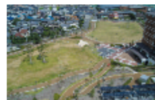
枚方市北片鉾町地区（防災公園街区整備事業）