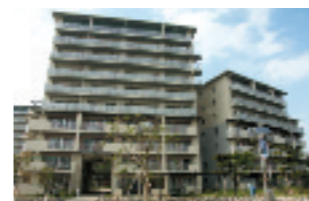
高根台団地（建替事業）