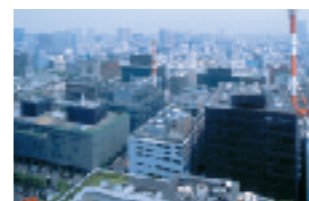
大手町地区（都市機能更新事業）