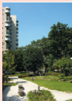
《表紙の風景》 多摩平の森（東京都日野市） 次々と斬新な住棟に建替えられている旧多摩平団地。「緑の継承と育成」をテーマに、開発以前からの樹齢50～70年の大樹も保存され、木漏れ陽がキラキラと美しい。