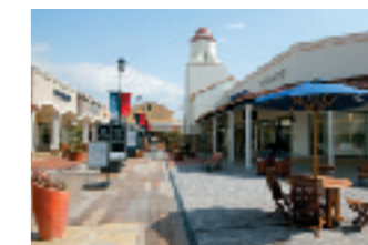
鳥栖北部丘陵新都市