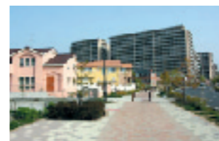
彩都（ニュータウン整備事業）