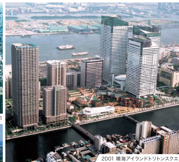
2001 晴海アイランドトリトンスクエア