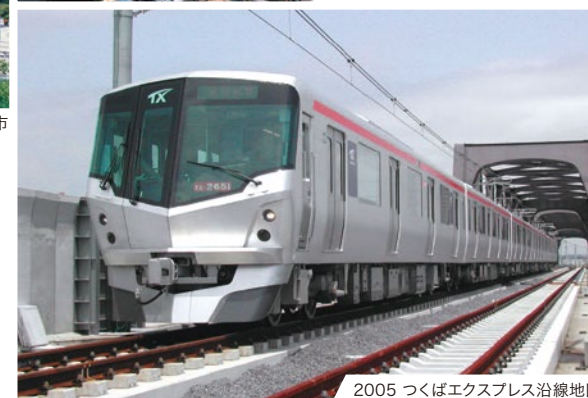
2005 つくばエクスプレス沿線地区