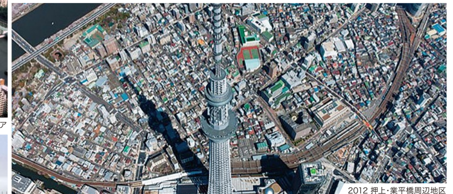
2012 押上・業平橋周辺地区