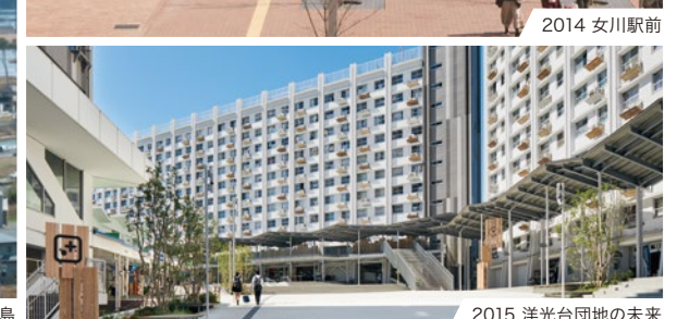
2015 洋光台団地の未来