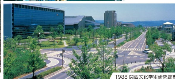
1988 関西化学術研究都市