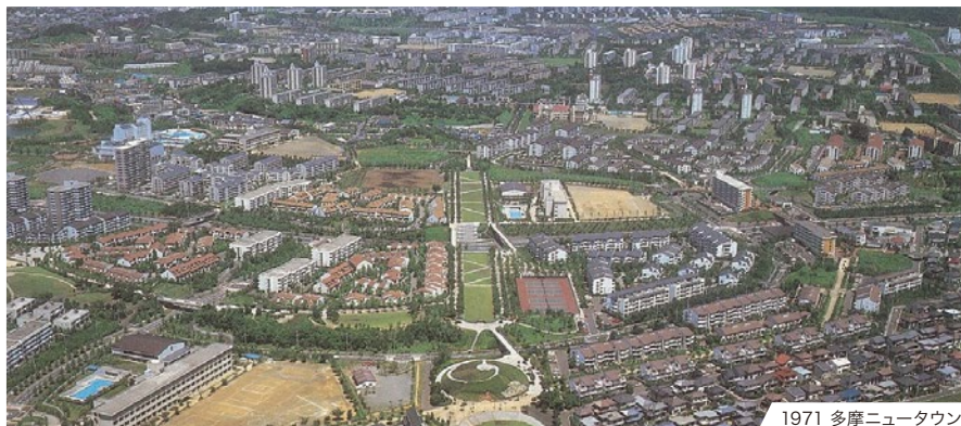
1971 多摩ニュータウン