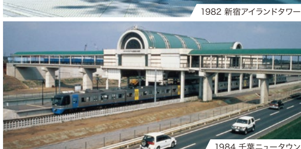
1984 千葉ニュータウン