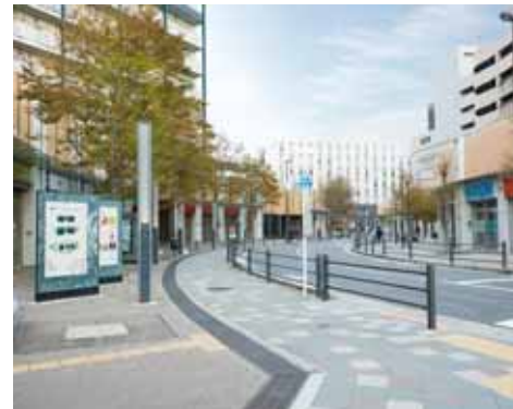
ゆとりのある歩行空間を確保した地区内道路