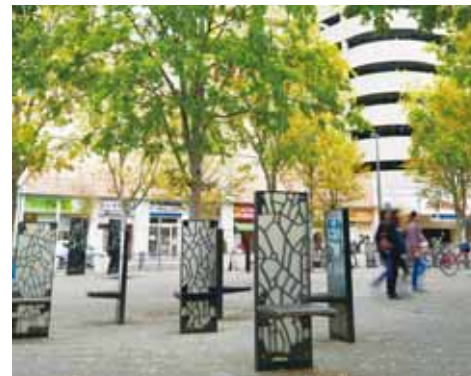
新たに整備された駅前広場