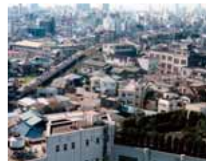
開発前の事業エリア