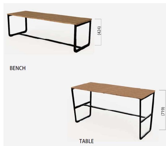
MUJI×UR 共同開発パーツのストリートファニチャー「つながるベンチ」イメージ