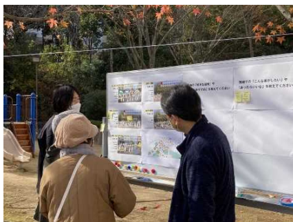
広場活用に関するアンケートの様子