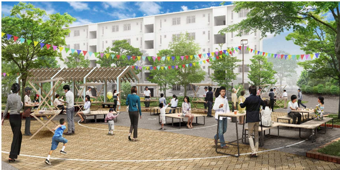
泉北茶山台二丁団地 屋外共用部改修イメージ

中宮第3団地では、プール跡地の活用を含む広場の使い方を居住者や地域の方々と検討するワークショップを開催し、共用部の活性化に取り組みます。