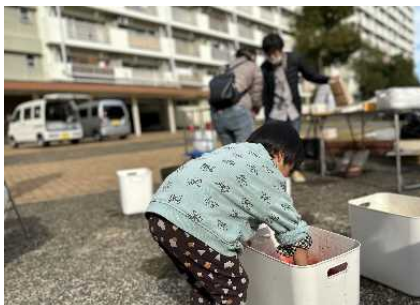
染物体験イベントの様子

2022年12月3日（土）、先行して団地の広場を使ったイベントを開催し、参加された方や通行された方に広場に関するアンケートを行いました。