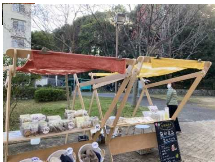
良品計画による出張販売