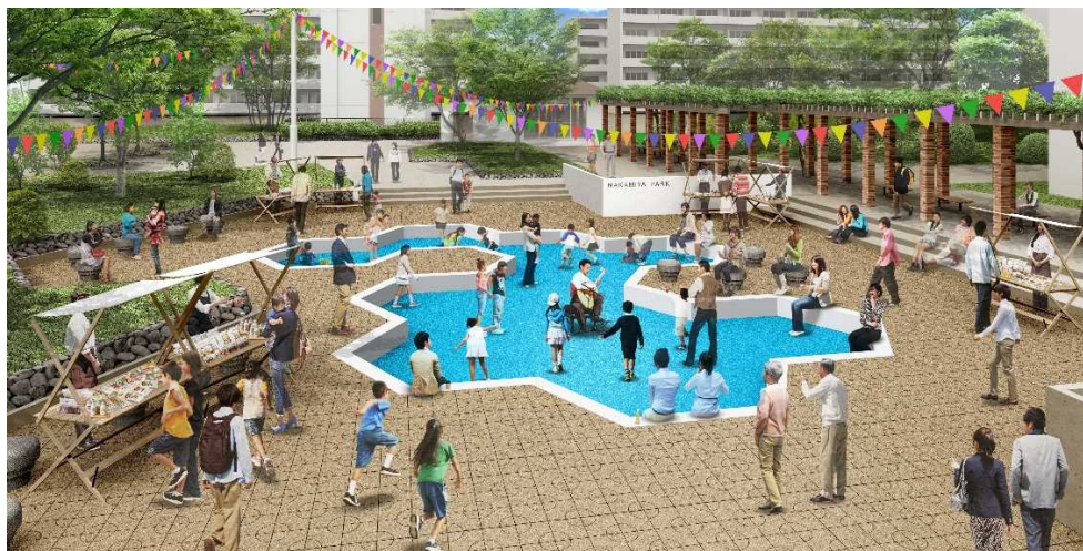
中宮第3団地 六角形平面プール跡がある広場空間でのイベント開催時のイメージ