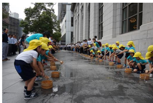
【昨年の打ち水の様子】

※取材をご希望の方は、8月7日(水)までに別添申込書に必要事項をご記入の上、FAXにてご連絡ください。