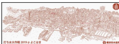
打ち水大作戦 2019@よこはま オリジナル手ぬぐい

ご参加いただいた方には、オリジナル手ぬぐい、はまっ子どうし The Water(ポルドウォーター)を差し上げます。