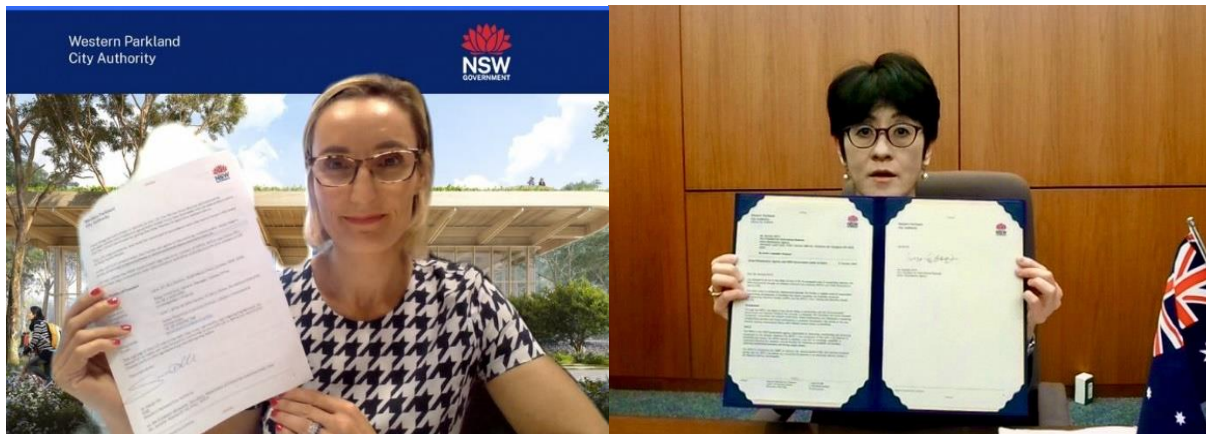
文書署名時の様子

UR都市機構は、本文書に基づく連携を通じて当地の都市開発の推進に寄与し、日本企業の進出機会の創出を図ってまいります。