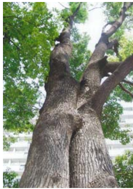
応募者メッセージ

まるで、二つの樹が夫婦で寄り添っているかのようである。二人で力強く支えあって立ち、この団地に住む家族の姿を優しく見守り続けてきたのだろうか。私たちもこんな風に支えあう二人でありたい。これからもずっと。