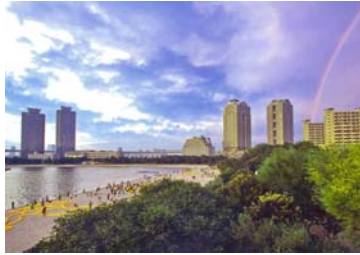
応募者メッセージ

海の日、ローソクによる地上絵作成の準備中に弱い雨が降り、雨後に虹が出ました。東京の臨海副都心エリアの観光スポットの近くにありながら緑に囲まれた静かな団地は、一度は住んでみたい憧れの団地です。