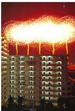
応募者メッセージ

江戸川花火大会の夜、ベランダ越しに打ち放たれる光と音の「競演」は、華やかというよりはドキドキ・ハラハラするような、まさしく「響演」「驚宴」である。川辺を臨む団地全体が、一夜限りの大劇場に化すのである。