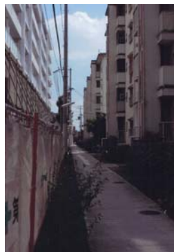
応募者メッセージ

時の流れの間には、細く長い道があります。いったいどれくらいの人たちがこの道を歩いたことでしょうか。。。過去があつて今があり、そして未来に続いている道、耳を澄ませばそこに生きる吐息が聞こえてきます。