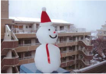
応募者メッセージ

外は寒いです。でも家の中は暖かいです。あー幸せ。家の中でも外でもハッピーUR ライフです。My happy home. UR (You are) the BEST.