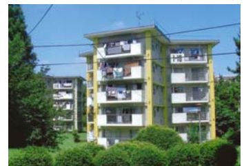
応募者メッセージ

夏休みの宿題で、団地に住んでいる人の数を調べたら、この星がた住たくが今でも一番たくさんの方が住んでいる事がわかりました。今も昔も、人気ナンバーワンのかっこいい住たくです。