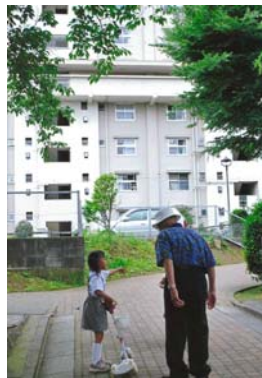
応募者メッセージ

何を話しているのだろうか？お孫さん？それとも近所の子なのかな？ふふ、きっと何かいいことでもあっておじいちゃんに何か伝えたいんだね。大丈夫、おじいちゃんもしっかり耳を傾けてくれているよ。