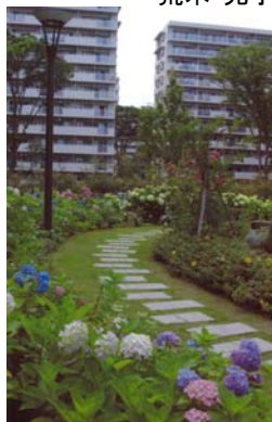
応募者メッセージ

何回歩いたことが。本当にきれいな花花花 友だちと歩き、娘と歩き、孫と歩き、遠い友を招んで歩き、幸せをかみしめています。