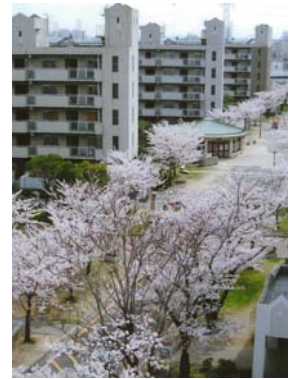
応募者メッセージ

一度遊びにおいてと誘われ、一昨年、九州博多を離れた息子夫婦の団地へ。「よか眺めやね」と言うと「下見ん時これが決め手になったったい」って。桜色に染まる団地で、息子はまだ関西弁には染まっていないようだ。