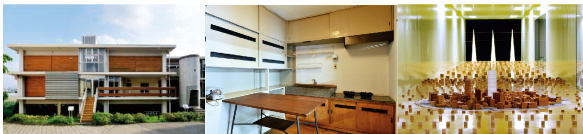
集合住宅歴史館（左：外観、中央：蓮根団地の復元住戸）、風洞実験棟測定洞（右）

通常公開している「集合住宅歴史館」等の展示施設に加えて、特別公開として「振動実験棟」と「風洞実験棟」も公開します。実験実演や体験イベント及びパネル展示等を通じて、機構がこれまで取り組んできた技術開発を紹介します。