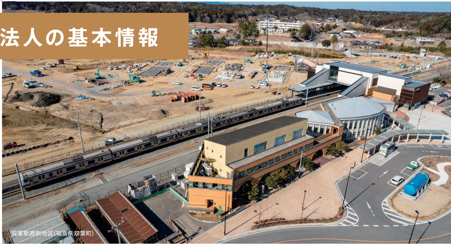
双葉駅西側地区(福岡県双葉町)