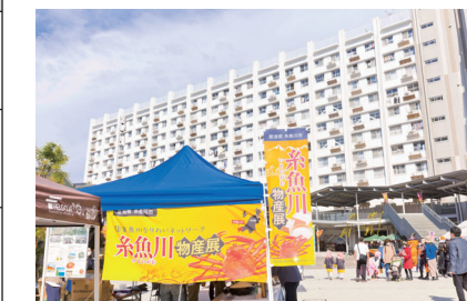
人で賑わうプチマルシェ