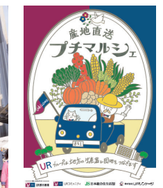
プチマルシェの看板