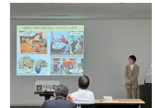
最終プレゼンテーション