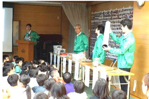
クイズに答える児童たち