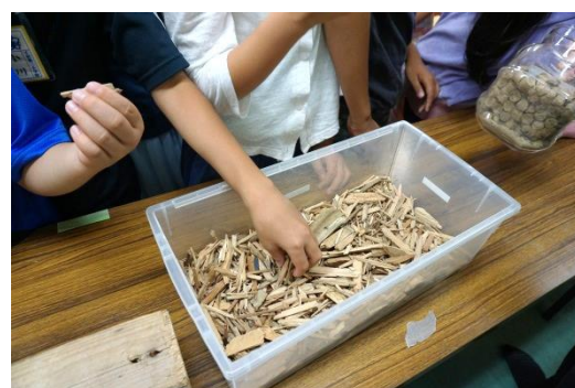
展示コーナーの様子