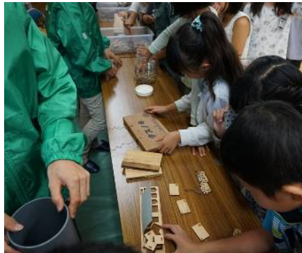
展示コーナーの様子