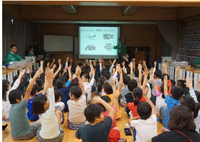
クイズに答える子供たち