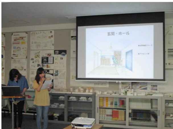
コンペ発表会（2015年7月）