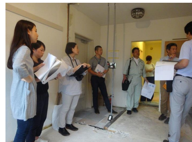
住戸でのプラン調整（2015年9月）