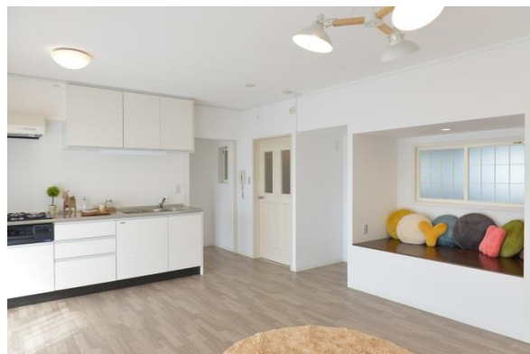
洛西新林北団地 4-703「光と風がとおる家」