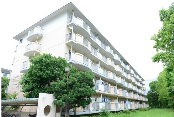
洛西竹の里団地（外観）

http://www.kyoto-wu.ac.jp/gakubu/kasei/zokei/index.html