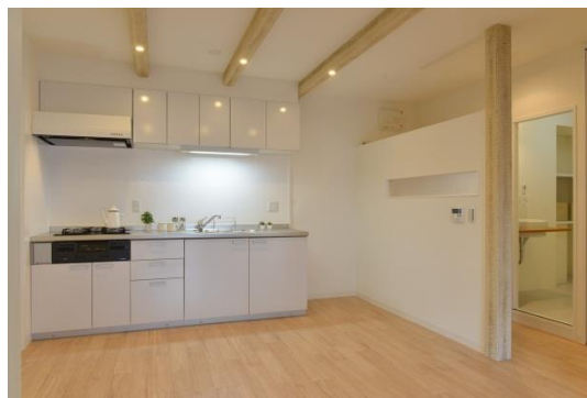
洛西竹の里 14-206 「空間を彩るアクセント」