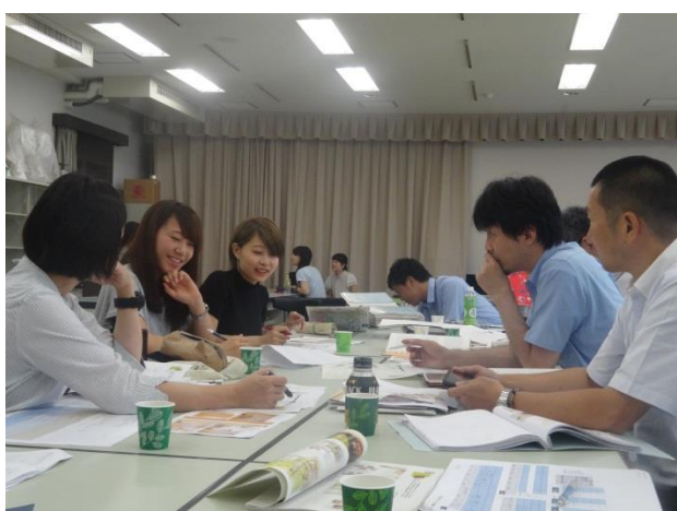
設計打ち合わせ（2015年8月）