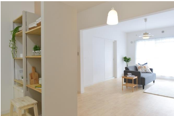
洛西竹の里団地 14-302「整える暮らし」【学長賞受賞】

つきましては、1月23日（土）開始の一般公開に先立ち、報道関係者の皆様を対象とした住戸内覧会を12月10日（木）に開催いたしますので、ご取材くださいますようお願い申し上げます。