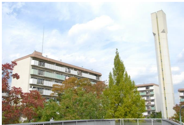
洛西新林北団地（外観）