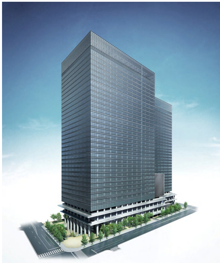
完成予想図（南西側から見る）