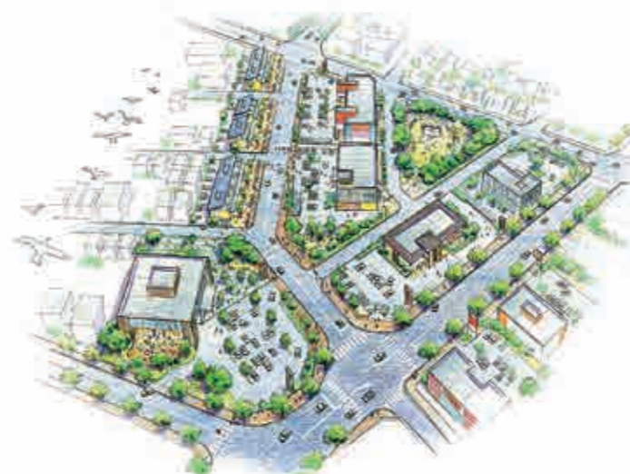
南気仙沼地区商業地イメージ