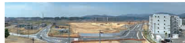
南気仙沼地区工事状況