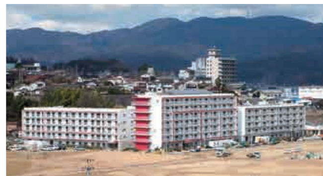
市営幸町住宅(災害公営)