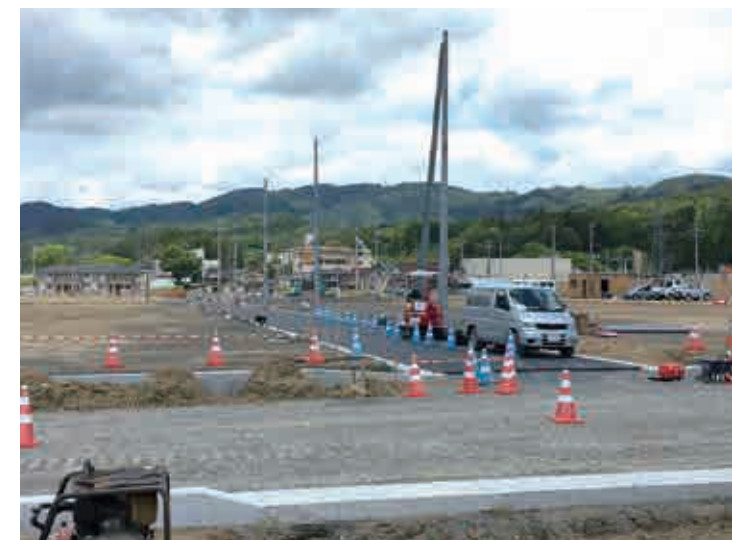
鹿折地区工事状況