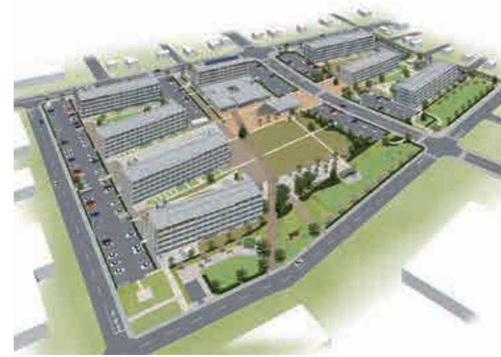
鹿折地区災害公営住宅 完成イメージ図