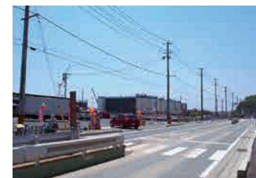
片浜鹿折線（平成28年3月供用開始）