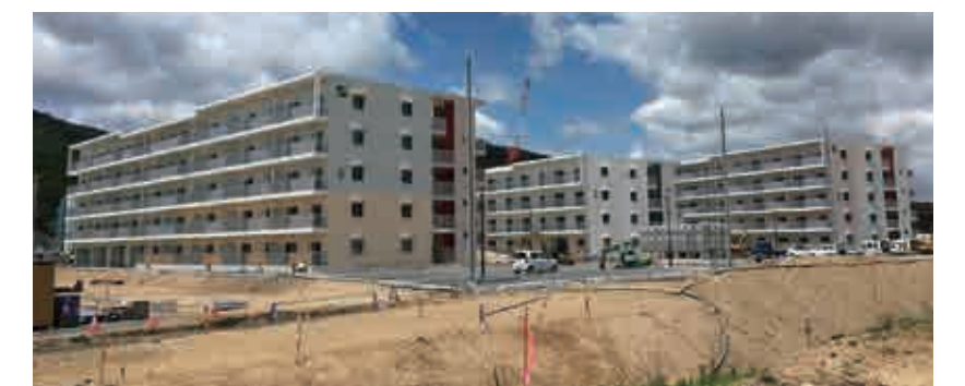
鹿折地区災害公営住宅