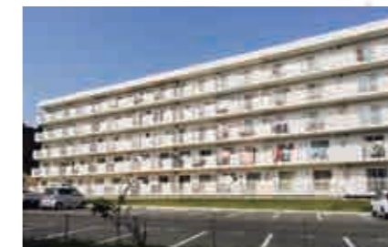
地区隣接の災害公営住宅