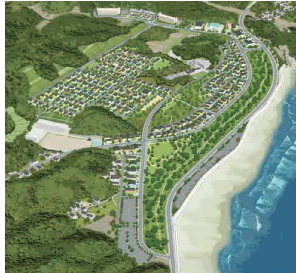
鳥瞰イメージパース

鳥瞰パースは、イメージであり、実際の宅地や建物等とは異なります。現在、一部事業計画の変更を予定しています。