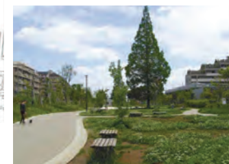
[市街地エリア]＝「防災公園予定地」全体配画図