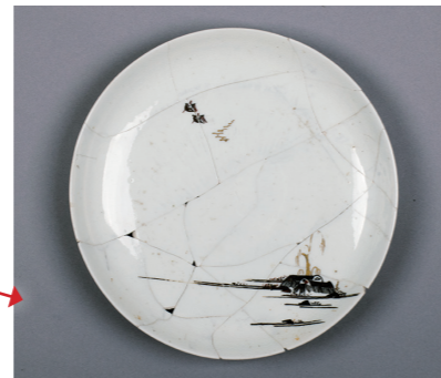
ほぼ完全なかたちに復元できました!