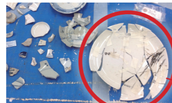
あ、これは、結構かたちになるかも…