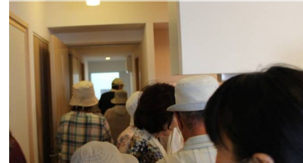
※災害公営住宅敷地近傍にモデルルームを設営。