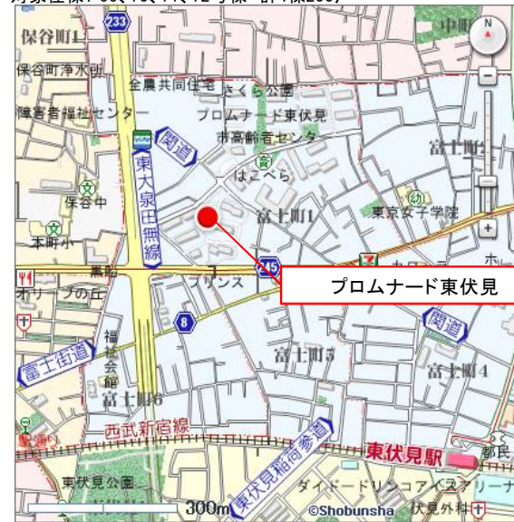
地図使用承認©昭文社第56G107号

団地名：プロムナード東伏見 所在地：東京都西東京市富士町一丁目7番 管理開始：平成8年～平成17年 対象住棟：66、70、71、72号棟 計4棟200戸