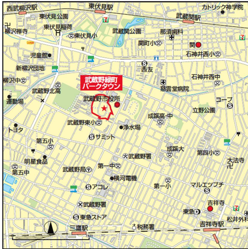
○武蔵野緑町パークタウン 工事施工箇所図