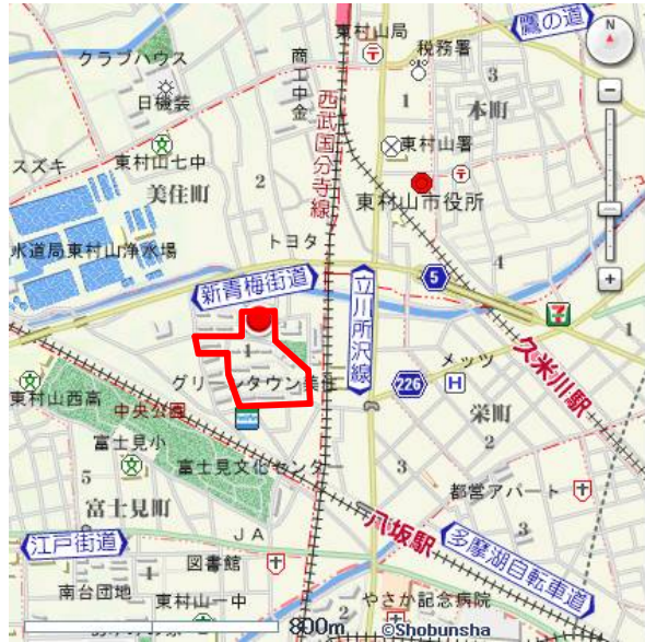
地図使用承認©昭文社第56G107号