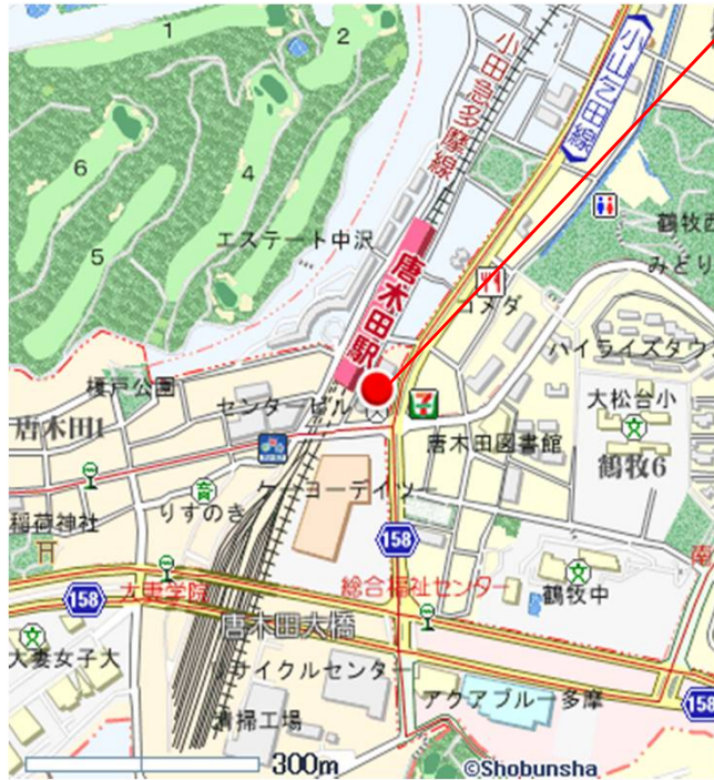
地図使用承認©昭文社第56G107号