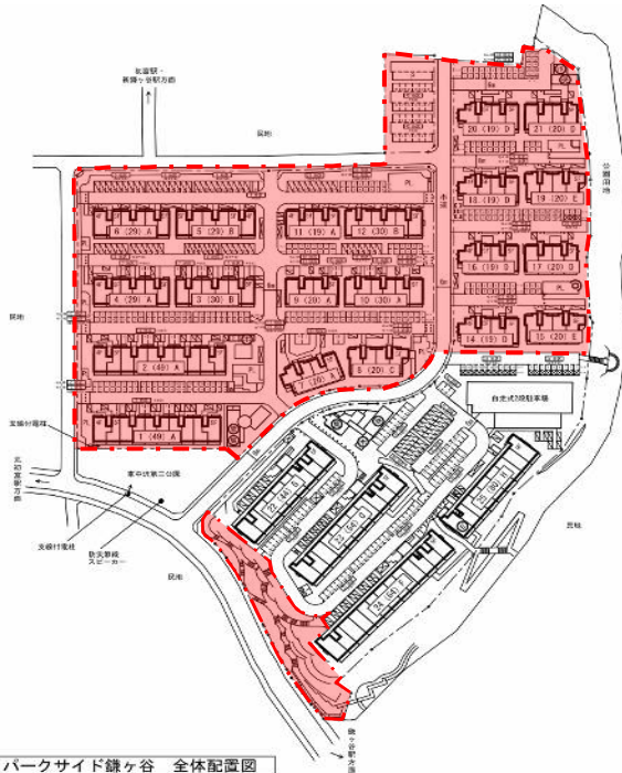
パークサイド鎌ヶ谷 全体配置図