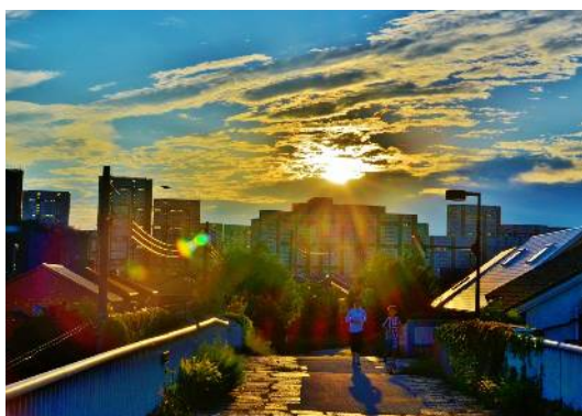
団地景観 フォト大賞