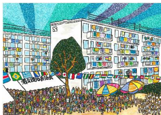
団地景観 スケッチ大賞