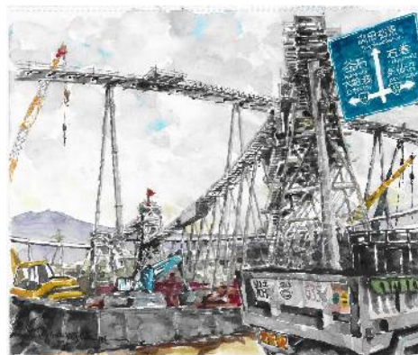
復興 スケッチ大賞